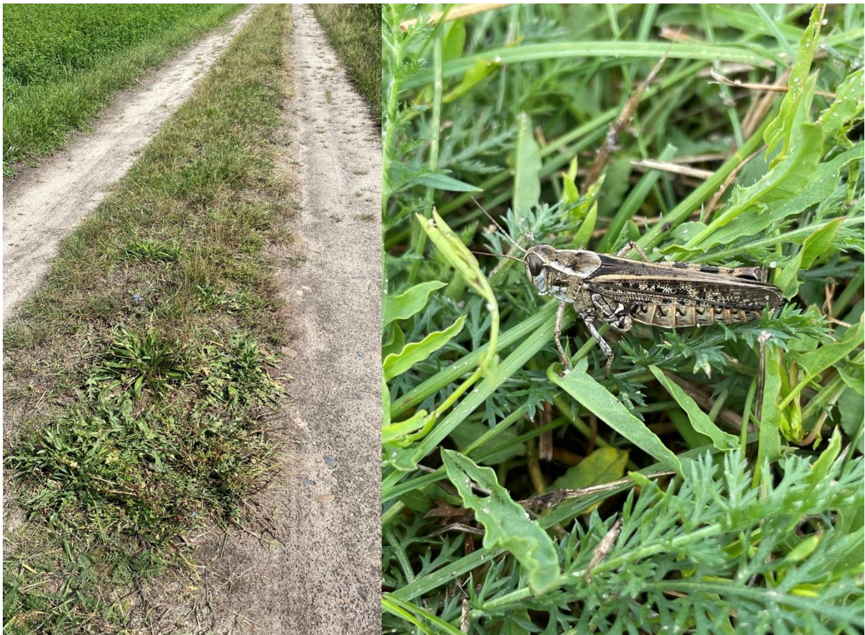
Abb. 2: Calliptamus italicus auf Feldweg bei Mallenchen an BAB 13.

Die Großlandschaft liegt im Gebiet der Bergbaufolgelandschaft um Calau. Die Böden sind sandiger Natur und im Großraum gibt es mehrere Sukzessionsflächen der Bergbaufolgelandschaft. Das untersuchte Gebiet links und rechts der BAB 13 war von zahlreichen Feldwegen durchzogen, welche teils von Hecken oder Baumreihen gesäumt waren (Abb. 1). Krautsäume gab es nur in den Bereichen, wo eine Heckenstruktur vorhanden war. Dort ging dann gelegentlich aus der Hecke kommend ein schmaler Krautsaum bis zum Feldwegrand hervor. An den meisten Feldwegen war kaum bis gar keine Krautschicht vorhanden. Die Wege waren relativ fest, wenngleich nicht explizit befestigt, aber eben keinesfalls rein sandig. Die Vegetation auf sämtlichen Feldwegen und deren unmittelbaren Rändern war zu diesem Zeitpunkt sehr niedrig (Abb. 2). Durch diese niedrige Vegetation war es nicht schwer, C. italicus herumphüpfend auf den Feldwegen zu entdecken. Es wurden aber keine fliegenden Tiere festgestellt. Der erste Fund war sechs Tiere unmittelbar an einem Weg an der BAB 13 (Abb. 1), wo ich aus dem Auto ausstieg und unmittelbar vor mir sechs Männchen wegsprangen. Zwar völlig irritiert von dieser unerwarteten Beobachtung war das Auge geschärft, wonach noch sechs weitere Beobachtungen von Einzeltieren in diesem Gebiet erfolgten. Insgesamt waren es 17 Männchen und 3 Weibchen. Die Tiere waren an ihren Einzelstellen stets dicht beisammen (ca. 1-2m Abstand).